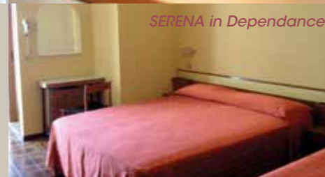
SENERA in Dependance

Nos chambres sont confortables et décorées avec élégance dans les tonalités crème et pastelle, elles donnent une sensation de bien-être et offrent un grand confort. Vous pouvez choisir entre la Confort , la Relax , Relax verte ou la junior suite Prestige